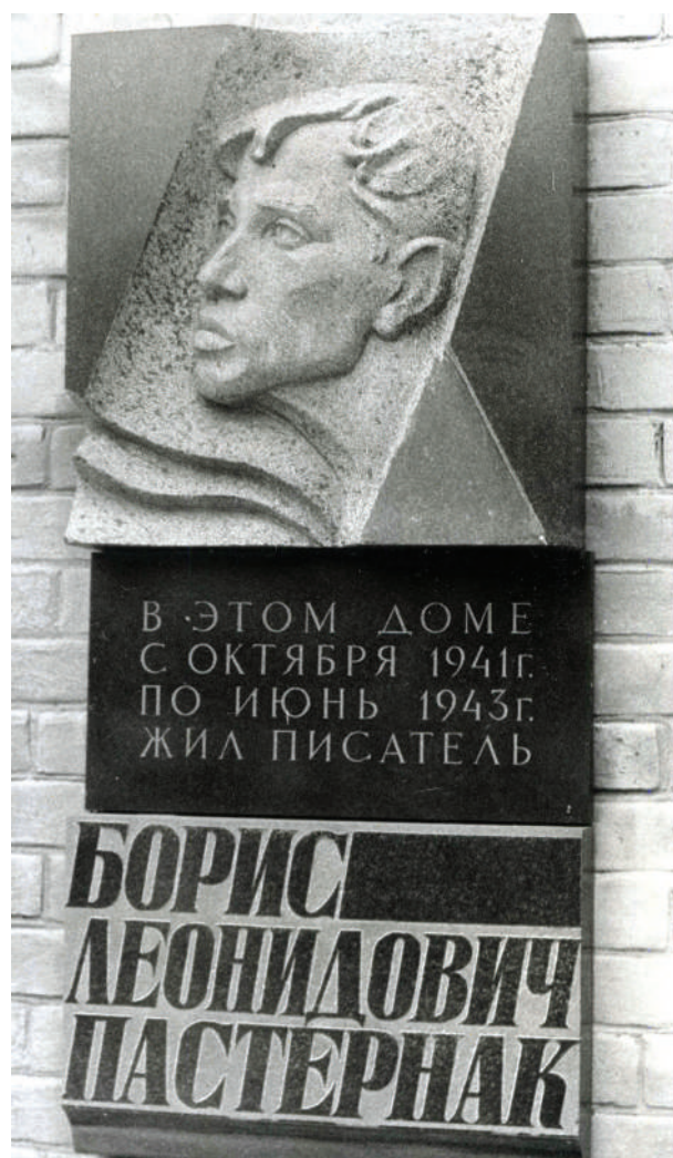
«Портрет Бориса Пастернака» Чистополь, 1990