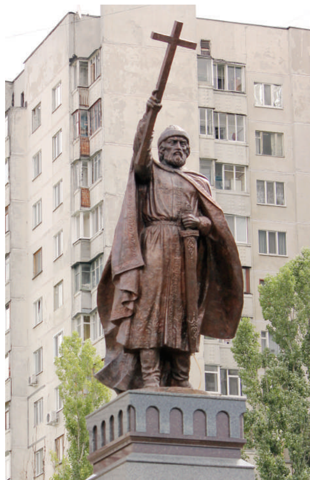
Святой Князь Владимир Свято-владимирский храм, Харьков, 2010