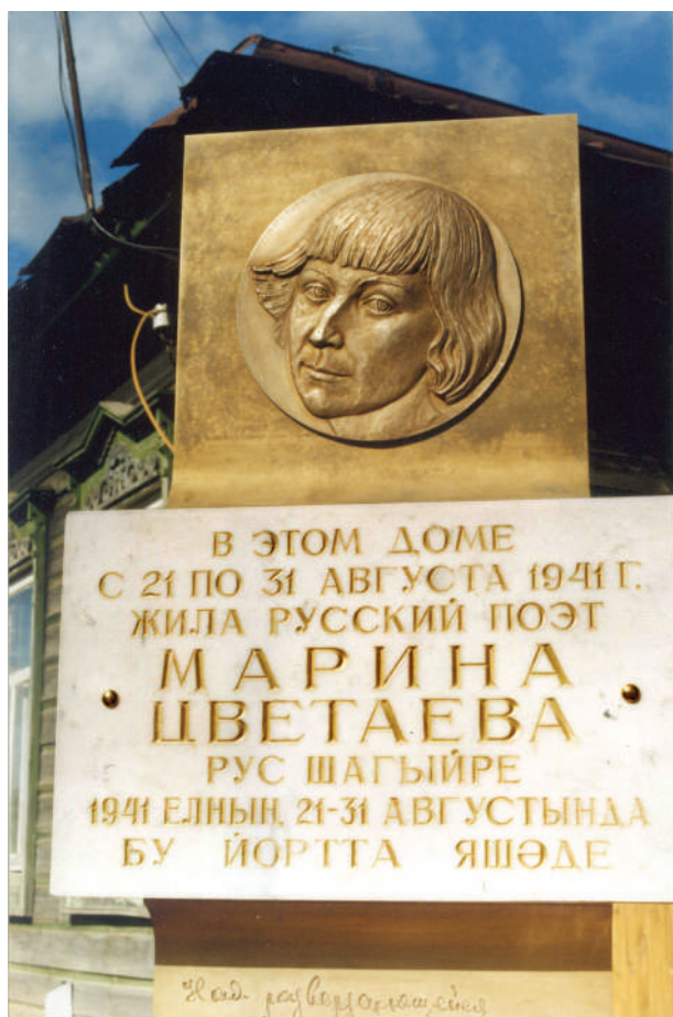
«Портрет Марины Цветаевой» Елабуга, 2005