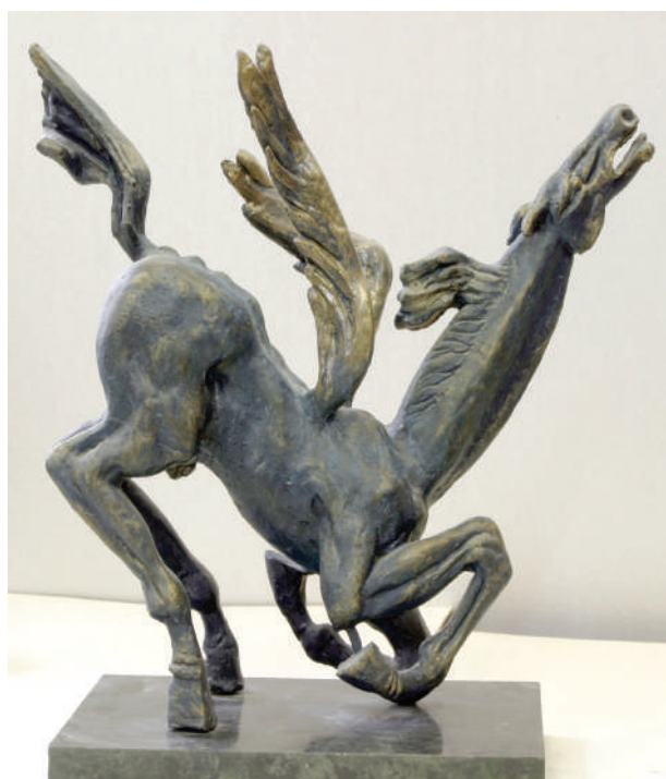
«Пегас» (Памяти поэтов, пострадавших от государственного режима)