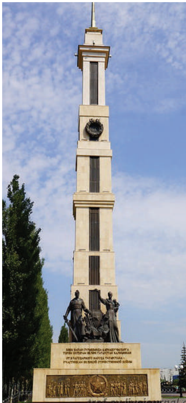
«День Победы» Казань, Татарстан, 2000