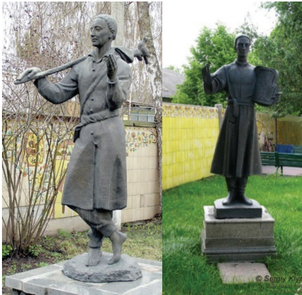
Пам'ятники Г. Сковороди в місті Переяслав-Хмельницький.