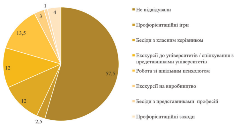
Рис. 2. Відвідування учнями шкіл України заходів з професійної орієнтації (%)

По-друге, профорієнтаційну діагностику проходили лише 9,5 % опитуваних. Без профдіагностики, аналізу своєї особистості та зіставлення своїх можливостей та вимог до професій профорієнтаційна робота втрачає свій сенс, адже головною метою профорієнтації є професійне самоусвідомлення та вдалий вибір професії випускником школи. Без аналізу своєї особистості та розуміння своїх здатностей неможливо обрати професію, вимоги до якої особистість зможе вдовольнити.